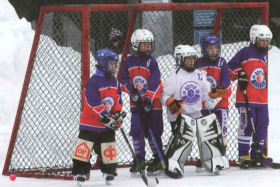
Elli ja joukkueen puolustajat valmiina torjumaan vastustajan kulmalyönnin.

EKS:n ringettetyttöjä Botnian P02 poikien jääpalljoukkueessa kaudella 2011-2012